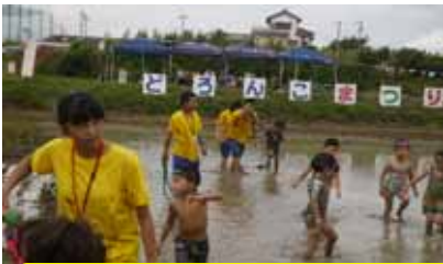
ボランティア活動参加 南部公民館 9 / 8 丈山小学校 9 / 15